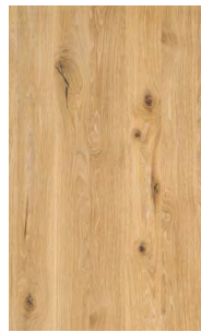
Eiche Wild Weißöl*